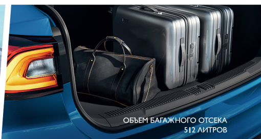
ОБЪЕМ БАГАЖНОГО ОТСЕКА 512 ЛИТРОВ