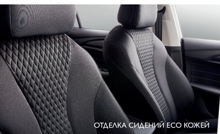
ОТДЕЛКА СИДЕНИЙ ЕСО КОЖЕЙ

ОТ 7 390 000 ₺ ГАРАНТИЯ 5 ЛЕТ ИЛИ 150 000 КМ