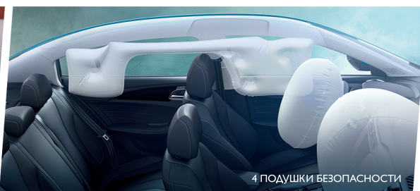
4 ПОДУШКИ БЕЗОПАСНОСТИ