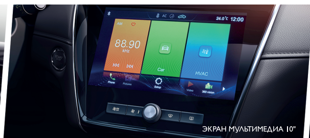
ЭКРАН МУЛЬТИМЕДИА 10"