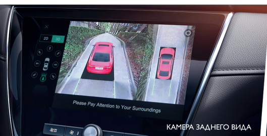
КАМЕРА ЗАДНЕГО ВИДА