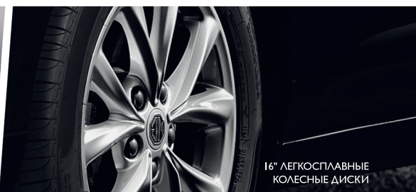
16" ЛЕГКОСПЛАВНЫЕ КОЛЕСНЫЕ ДИСКИ